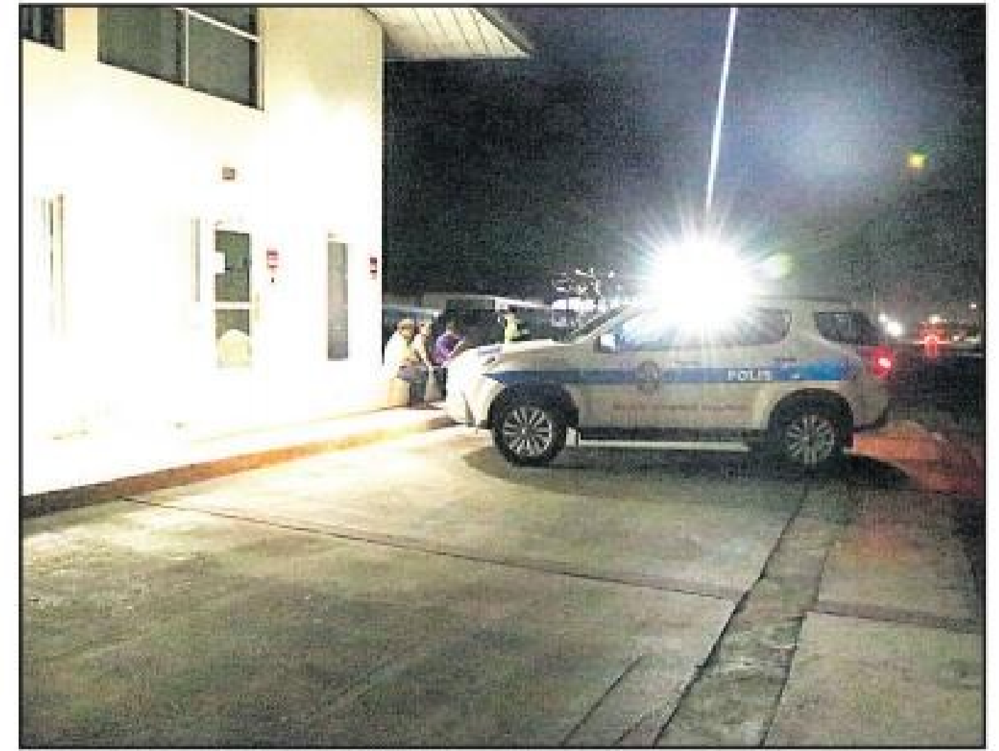
tambe ambulance. A trata cu e dama na nan tuma dato di loke a sosode y Paramediconan a yegada.

Polis di trafico a presenta algun rato despues y